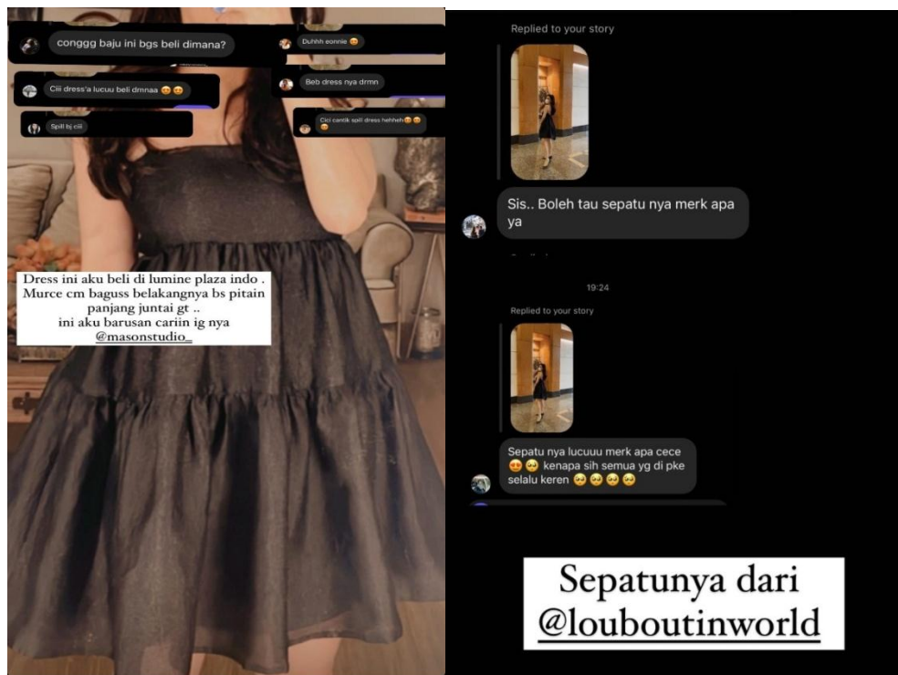
Gambar 5 Respon Followers dengan Produk yang diulas Michie