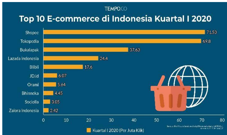
Gambar 1 Data Statistik E-Commerce Indonesia 2020

sekitar 30% konsumen merencanakan untuk lebih sering berbelanja secara daring ( online ). Berdasarkan rilis dari Greatnesia.com (2020), antusias masyarakat Indonesia sangat tinggi untuk memilih berbelanja di beberapa marketplace seperti yang tersaji pada gambar 1 berikut.