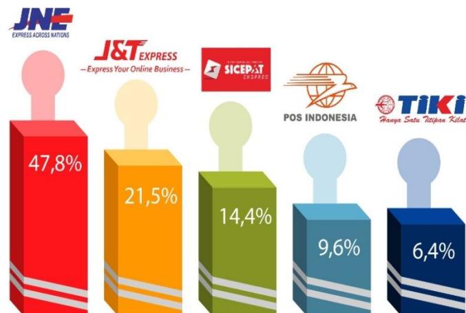
Gambar 2 Persentase Jasa Ekspedisi yang dipilih Konsumen Selama Kondisi Pandemi Tahun 2020

Aminah (2020) mengemukakan bahwa PT Pos Indonesia sebagai pelopor ekspedisi di Indonesia mencatat penurunan yang terjadi selama pandemi tahun 2020. Pada PT Pos Indonesia yang berlokasi di Cianjur, Jawa Barat umumnya mencatat transaksi per hari 50-60 pelanggan namun imbas dari pandemi menyebabkan turunnya jumlah transaksi menjadi 20-30 pelanggan. Berdasarkan informasi dari Hidayat (2020), terlampir persentase ekspedisi yang dipilih konsumen selama masa pandemi. Ekspedisi JNE menempati posisi tertinggi yang disusul oleh ekspedisi JNT. PT Pos Indonesia menempati posisi dua terbawah yang menjadi pilihan konsumen.