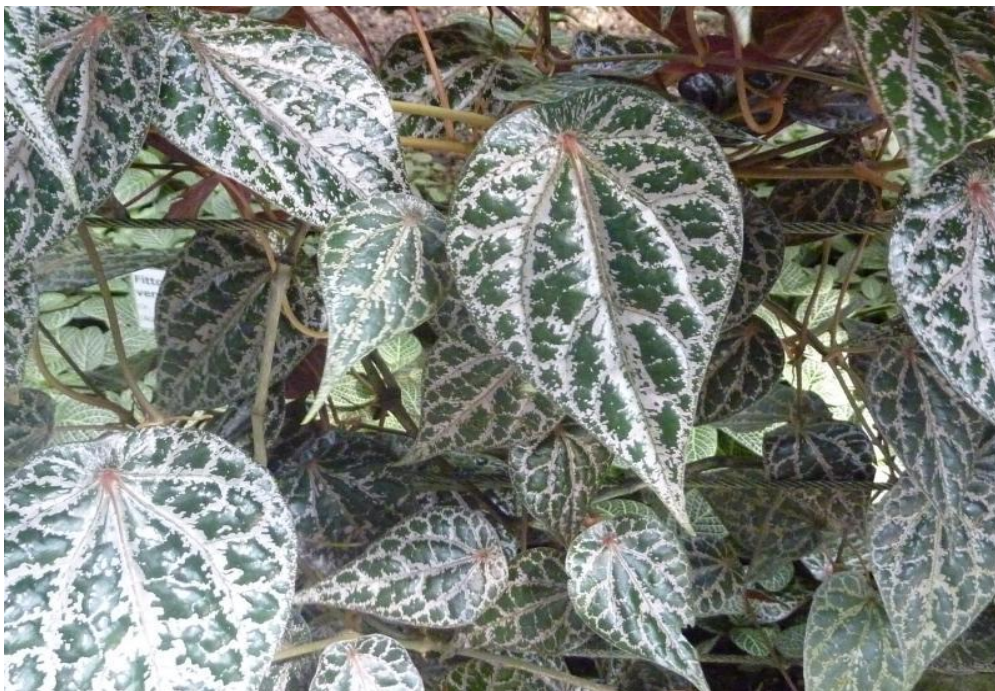
Gambar 1. Tanaman Sirih merah ( Piper crocatum Ruiz & Pav.)

Sinonim: Steffensia crocata Kunth; Artanthe crocata Miq. [10].