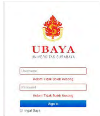
Gambar J.6 Uji Coba Username dan Kata Sandi tidak diisi

Pada Gambar J.7 akan ada uji coba frontend untuk menampilkan data dari server dengan skenario tidak terdapat koneksi internet. Aplikasi akan menampilkan pesan kepada pengguna bahwa tidak terdapat koneksi internet.