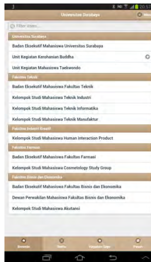
Gambar J.8 Uji Coba dengan koneksi internet

Kemudian pada tahap validasi, dilakukan melalui wawancara kepada beberapa mahasiswa aktif Universitas Surabaya dan pengurus organisasi mahasiswa Universitas Surabaya. Dari hasil wawancara didapatkan hasil :