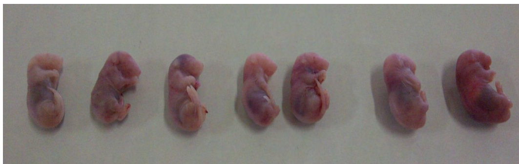
Gambar 1. Janin Normal