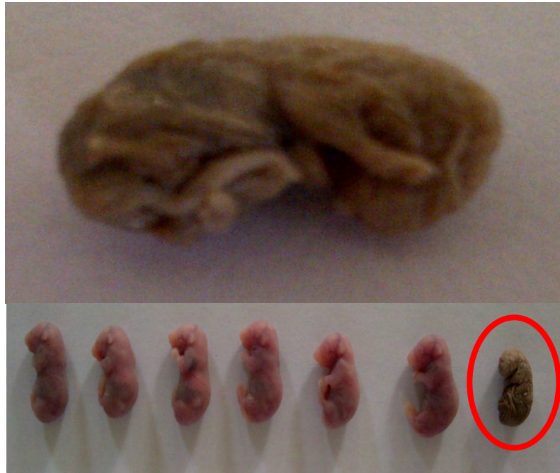
Gambar 2. Abnormalitas Janin (Cacat Fisik & Kekerdilan)