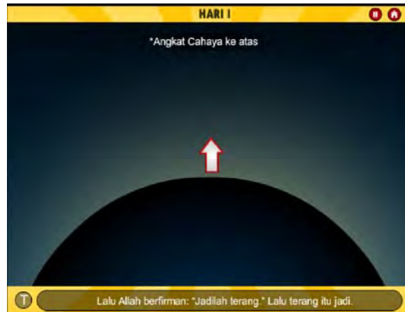
Gambar 2. Halaman Fitur Interaktif Alkitab