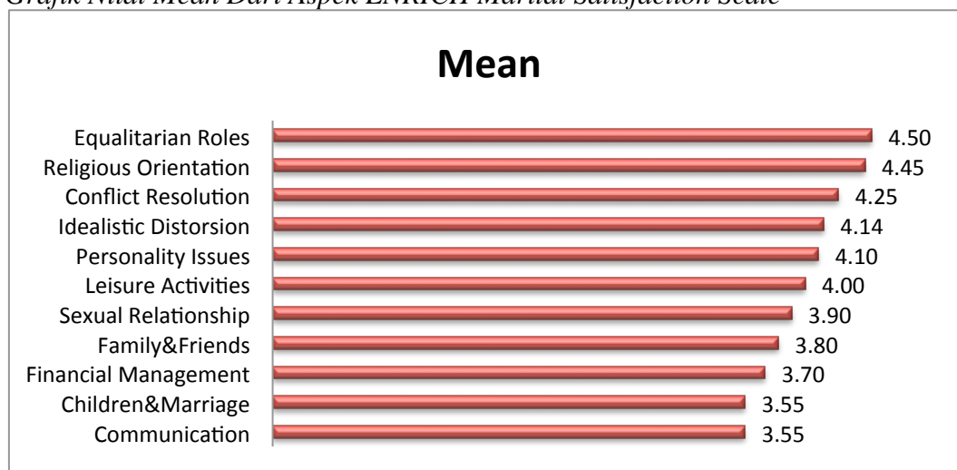
Grafik 1. Grafik Nilai Mean Dari Aspek ENRICH Marital Satisfaction Scale

Berdasarkan hasil penelitian, kepuasan perkawinan suami yang menjadi caregiver dari istri yang menderita kanker adalah sangat tinggi dengan persentase 55% dari keseluruhan suami (tabel 24). Hal ini sesuai dengan hasil penelitian dari Dorval, et. al. (2005) yang mengatakan bahwa hubungan antara suami dengan istri menjadi lebih dekat setelah menerima diagnosa kanker dan penanganan. Pasangan juga dapat tetap menjalin relasi perkawinan dengan baik meski salah satu pasangan menderita penyakit berat apabila pasangan dapat saling menerima keadaan yang ada dan memahami bahwa keadaan pasangannya berbeda.