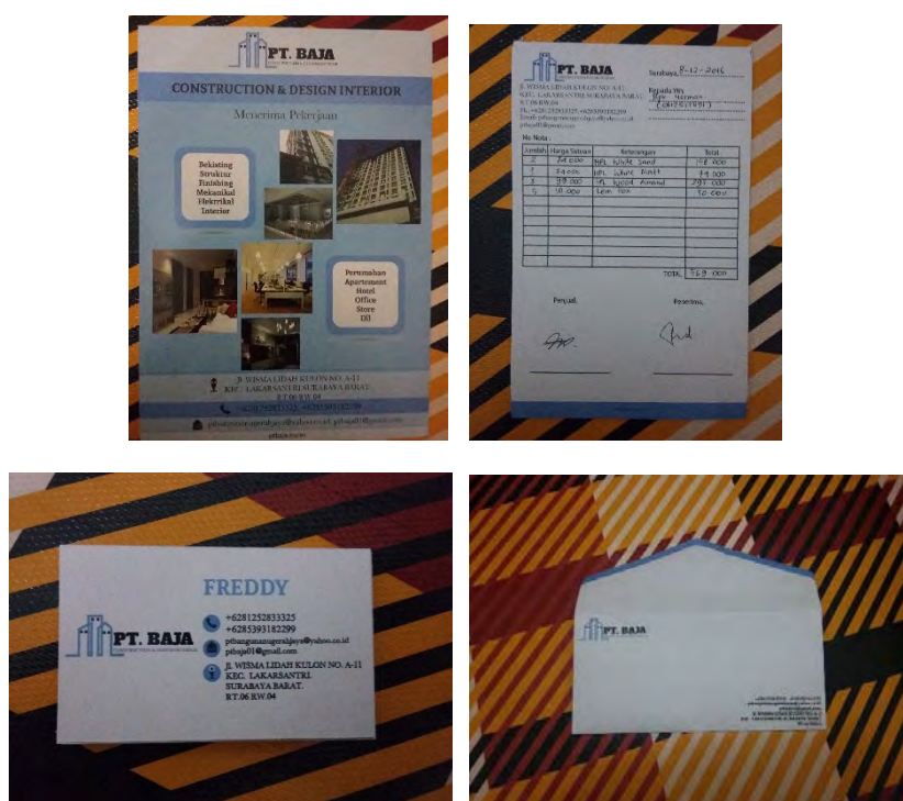
Gambar 2. Brosur & Nota Tulis

Pada stationery dan media cetak dilakukan pengecekan pada desain yang telah dibuat. Pengecekan dilakukan pada media cetak dan juga stationery yang dapat dilihat pada Gambar 2. Hasil akhir yang sudah dicetak warnanya dan tipografinya sudah sesuai dengan apa yang didesain.