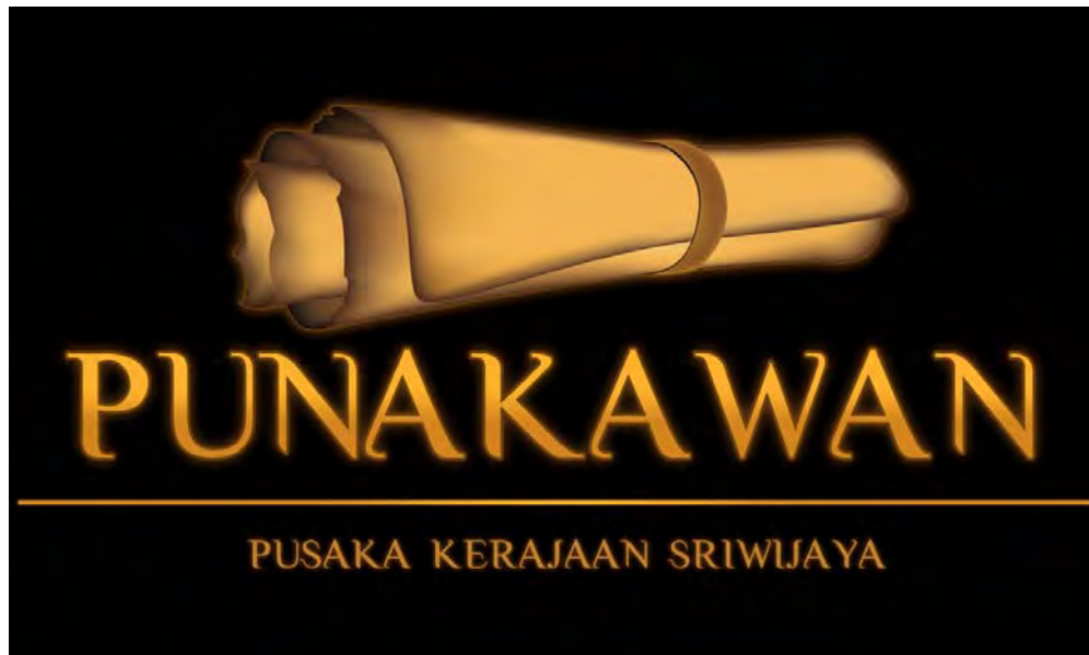
Gambar 1. Logo film Punakawan

Logo "Punakawan" memiliki beberapa konsep yang sesuai dengan film. Konsep - konsep tersebut sebagai berikut :