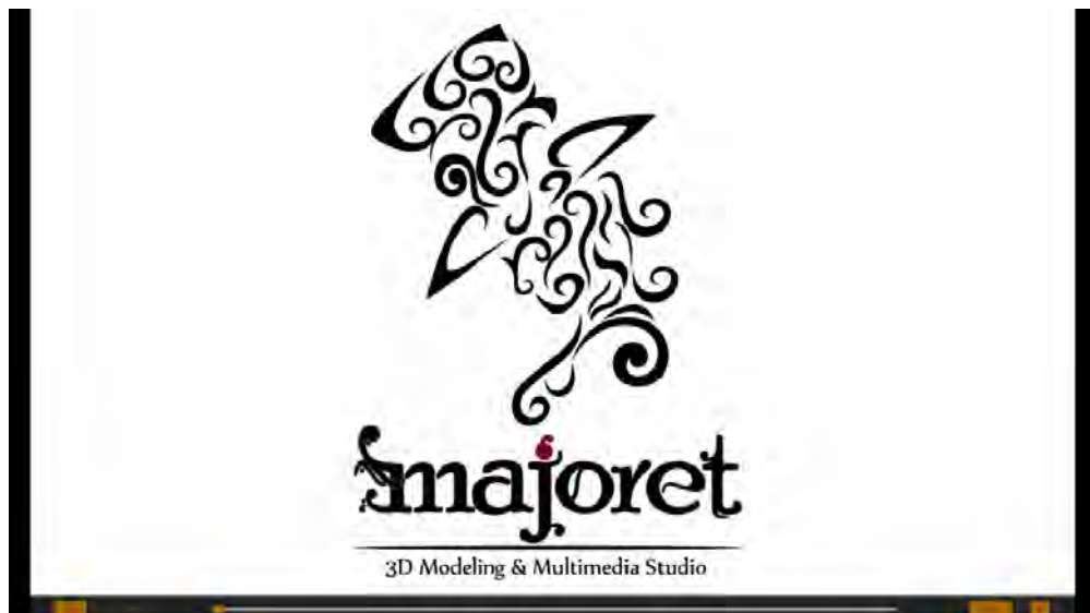
Gambar 3. Mainkan film

Pada desain halaman mainkan film terdapat seek bar , tombol "Toggle play - pause" untuk memainkan film dan pause film, tombol "Menu" untuk kembali ke menu utama, dan tombol "keluar" untuk menutup aplikasi. Tampilan halaman pilih adegan dapat dilihat pada gambar 3.