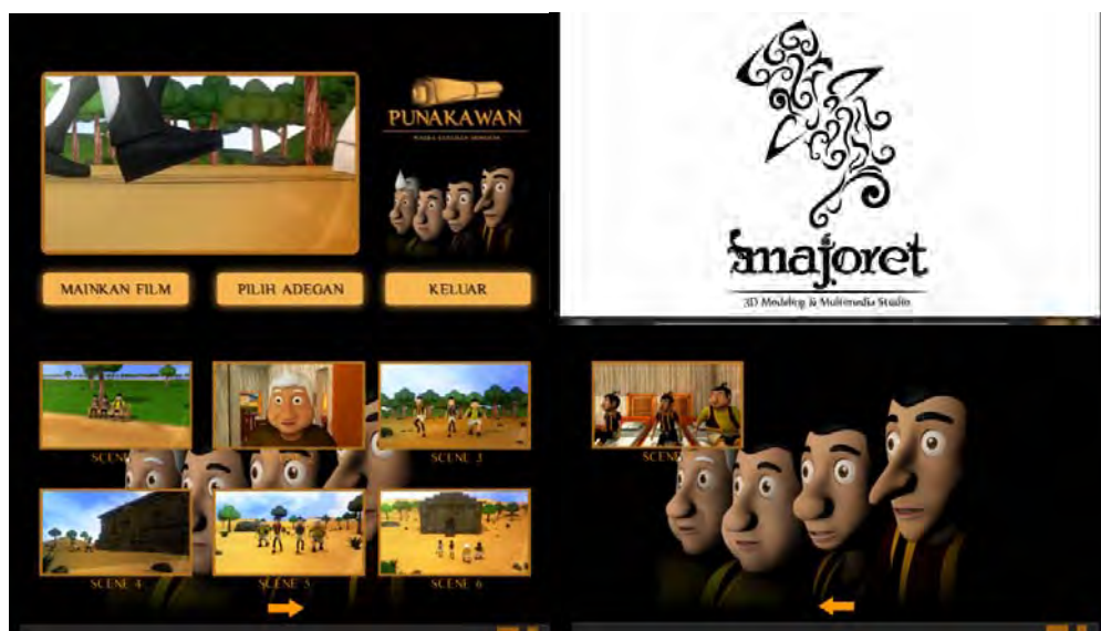
Gambar 5. Verifikasi Halaman

Film akan melalui proses uji coba dalam dua tahap yaitu tahap verifikasi dan tahap validasi. Tahap verifikasi akan dilakukan pada semua halaman menu film. Hal ini dilakukan untuk mengecek apakah ada kesalahan / error pada menu film. Hasil verifikasi beberapa halaman menu film dapat dilihat pada Gambar 5.