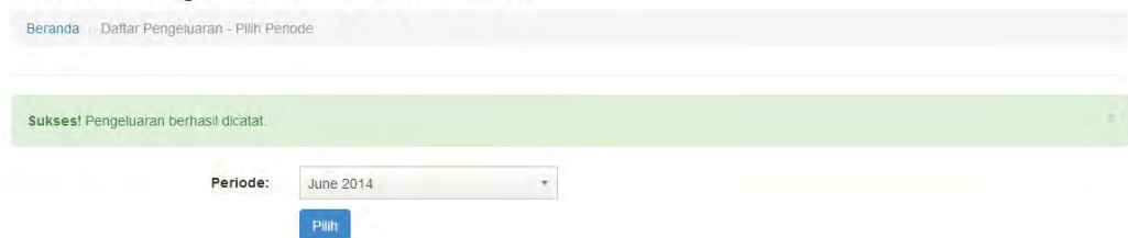
Gambar 2. Pemberitahuan Pencatatan Pengeluaran Berhasil Dilakukan