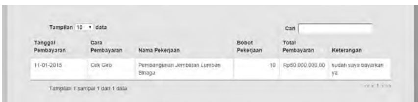
Gambar 5 Pembayaran