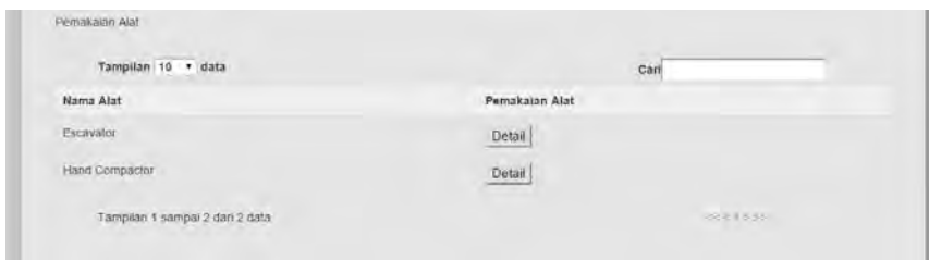
Gambar 4 Pemakaian Alat