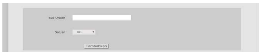
Gambar 7 Tambah Data Sub Uraian Pekerjaan