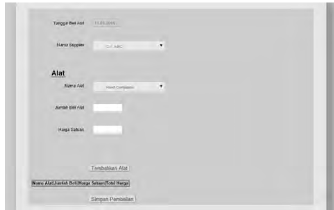
Gambar 8 Halaman Pembelian Alat

Menu ini memiliki beberapa sub menu yang berhubungan dengan pembelian. Setiap sub menu bertujuan untuk membantu admin menginputkan data pembelian alat maupun bahan. Gambar 8 merupakan tampilan halaman pembelian alat. Gambar 9 merupakan tampilan halaman pembelian bahan.