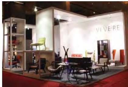
Gambar IV.15 Suasana Pameran

Strategi product launching dengan cara mempromosikan melalui pameran furnitur seperti di Indonesia Furniture Expo (IFEX) , Pameran Indonesia Furnitur Show , dan lain sebagainya. Saat pameran berlangsung, konsumen diberi penawaran diskon 10% dari harga display dan member pelayanan jasa antar produk ke lokasi secara gratis. Selain itu juga dengan cara menawarkan produk kepada pemerintah dan sekolah-sekolah dengan menyerahkan surat penawaran barang, brosur, dan modul mengenai produk KUBUKU. Untuk strategi advertising juga dilakukan melalui media sosial seperti Facebook dan Website . Media sosial berfungsi untuk menjangkau konsumen dari luar kota dan luar pulau.