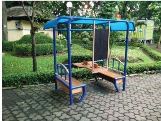
Gambar 5. Prototype