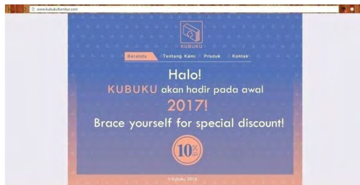
Gambar 13. Website