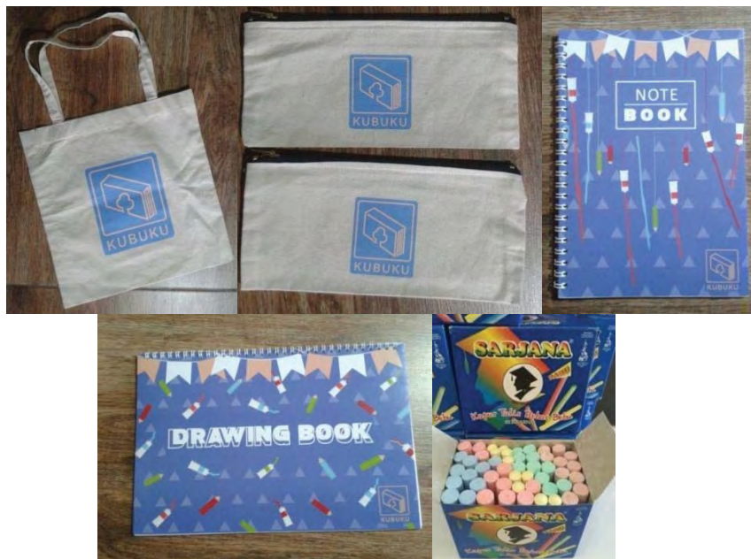
Gambar IV.14 Souvenir