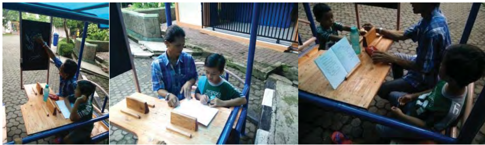
Gambar 6. Operasional