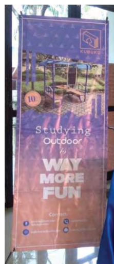
Gambar 10. X-Banner