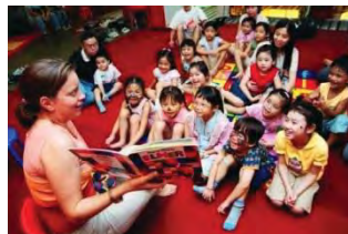
Gambar 1. Kegiatan membaca dan bercerita