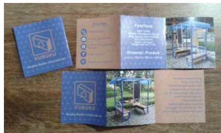
Gambar 8. Brosur