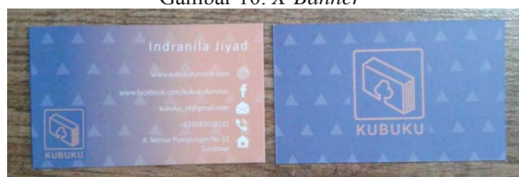
Gambar 11. Kartu Nama Tampak Depan dan Belakang