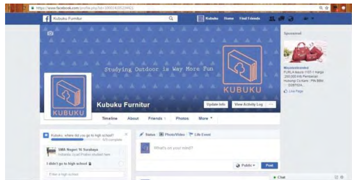
Gambar 12. Facebook