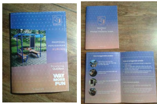
Gambar 9. Proposal Perusahaan dan Manual Book