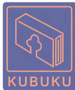
Gambar 7. Logo Kubuku