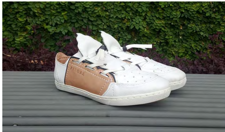
Gambar 3. Prototype

Desain ini terinspirasi dari bentuk mahkota, bentuk hiasan dahi, dan bentuk rambut dari tokoh topeng malangan yang disederhanakan dengan metode stilasi. Mahkota terdapat pada lidah sepatu, hiasan dahi terdapat pada heel sepatu, dan bentuk rambut terdapat pada bagian eyestay . Sesuai dengan tema vigilant , menggunakan teknik tumpuk dan ekspos jahitan luar. Sol yang digunakan sol karet, dengan material upper dari perpaduan kulit pull up dan kulit vachetta. Warna dominan adalah warna putih, sedangkan warna burlywood dan rich black sebagai warna sekunder