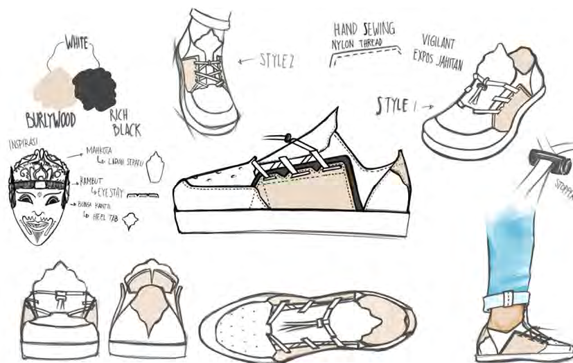
Gambar 1. Desain Akhir

Dari proses yang dilalui sebelumnya hingga pemilihan dari alternatif-alternatif desain, berikut ini adalah desain akhir dari produk sepatu yang dirancang: