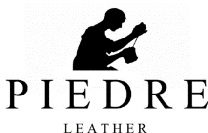
Gambar 4. Logogram Piedre