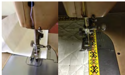
Gambar 12. Menjahit pola tas bagian dalam, luar, dan ornamen