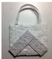
Gambar 8. Studi Model Terpilih

Setelah mengetahui 3 alternatif yang terpilih, maka langkah berikutnya adalah menentukan desain akhir. Pemilihan sebuah desain akhir didapat dari 3 alternatif sebelumnya yang dilakukan dengan cara Focus Group Discussion (FGD) dengan 3 peserta wanita berusia 17-25 tahun di Surabaya yang mengerti tren fashion . FGD dilakukan dengan cara menunjukan 3 studi model terpilih sebelumnya ke tiap peserta untuk dianalisa dan memilih 1 model tas yang paling disukai. Setelah melewati proses FGD dapat disimpulkan bahwa produk terpilih adalah alternatif ke 2.