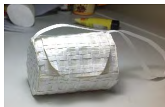
Gambar 5. Studi Model Alternatif 5