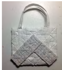
Gambar 3. Studi Model Alternatif 3