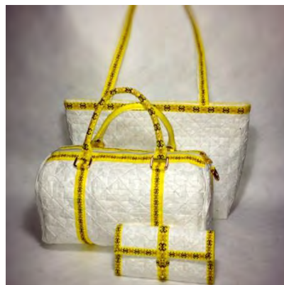
Gambar 13. Produk yang telah jadi