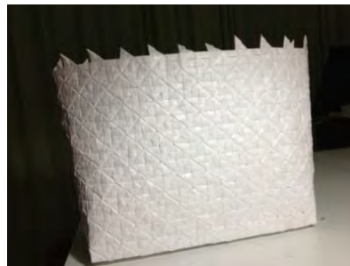
Gambar 11. Menganyam material yang telah dilipat