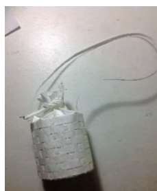
Gambar 7. Studi Model Alternatif 7

Dari 7 alternatif desain yang ditawarkan, dikerucutkan menjadi 3 desain terpilih untuk dianalisa lebih lanjut menjadi sebuah desain akhir. Pemilihan 3 alternatif ini dilakukan dengan cara menyebarkan kuisisioner pada 30 responden wanita 17-25 tahun dengan cara memilih sebuah desain yang paling disukai. Kemudian hasil kuisisioner dikombinasikan dengan melakukan skoring terhadap aspek-aspek desain untuk dilakukan pembobotan alternatif.