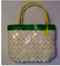
Gambar 1. Studi Model Alternatif 1