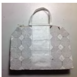
Gambar 6. Studi Model Alternatif 6