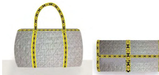
Gambar 9. Pengembangan Varian Desain

Sedangkan untuk dompet, varian desainnya sama dengan tas dan didesain untuk wanita 17-25 tahun. Model dompet panjang adalah ciri khas dompet wanita, sehingga diterapkan pada desain dompet tersebut.