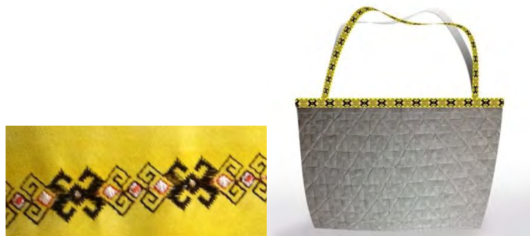
Gambar 8. Ornamen Bordir dan Desain Akhir

Hasil dari FGD 2 menunjukkan bahwa desain ornamen yang baru lebih sesuai dengan tema etnik modern yang diambil dari suku Dayak dibandingkan dengan hasil desain anyaman seperti yang dilakukan pada FGD 1 . Alternatif desain yang ditunjukkan pada responden terdiri dari 2 buah ornamen serupa namun diterapkan dengan teknik yang berbeda, yaitu dibordir dan satunya di print . Semua responden sepakat memilih motif ornamen yang dibordir daripada yang di print , karena dibordir hasilnya tampak lebih bagus.