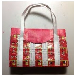
Gambar 4. Studi Model Alternatif 4