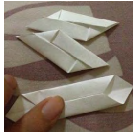
Gambar 10. Melipat material yang telah dipotong

Desain akhir yang terpilih diwujudkan menjadi produk nyata dengan skala 1:1. Proses pembuatan produk dilakukan dengan cara mengukur, memotong dan melipat material, menganyam material yang telah dilipat, membuat pola bagian dalam tas, dan menjahit menyatukan bagian dalam, luar dan ornament tas dan dompet.