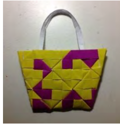
Gambar 2. Studi Model Alternatif 2