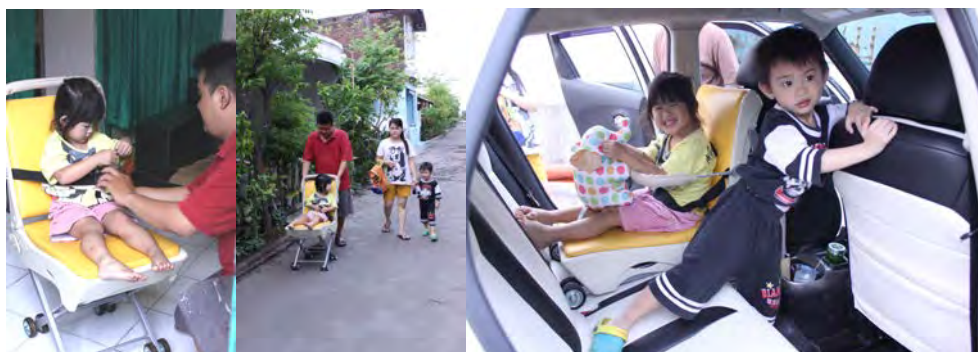
Gambar 11. Survey Reaksi Pasar

Prototype produk yang telah mencapai 100%, kemudian diujicobakan lagi kepada konsumen untuk mendapatkan feedback tentang produk, baik itu kelebihan produk maupun kekurangan yang perlu dibenahi lagi ke depannya.