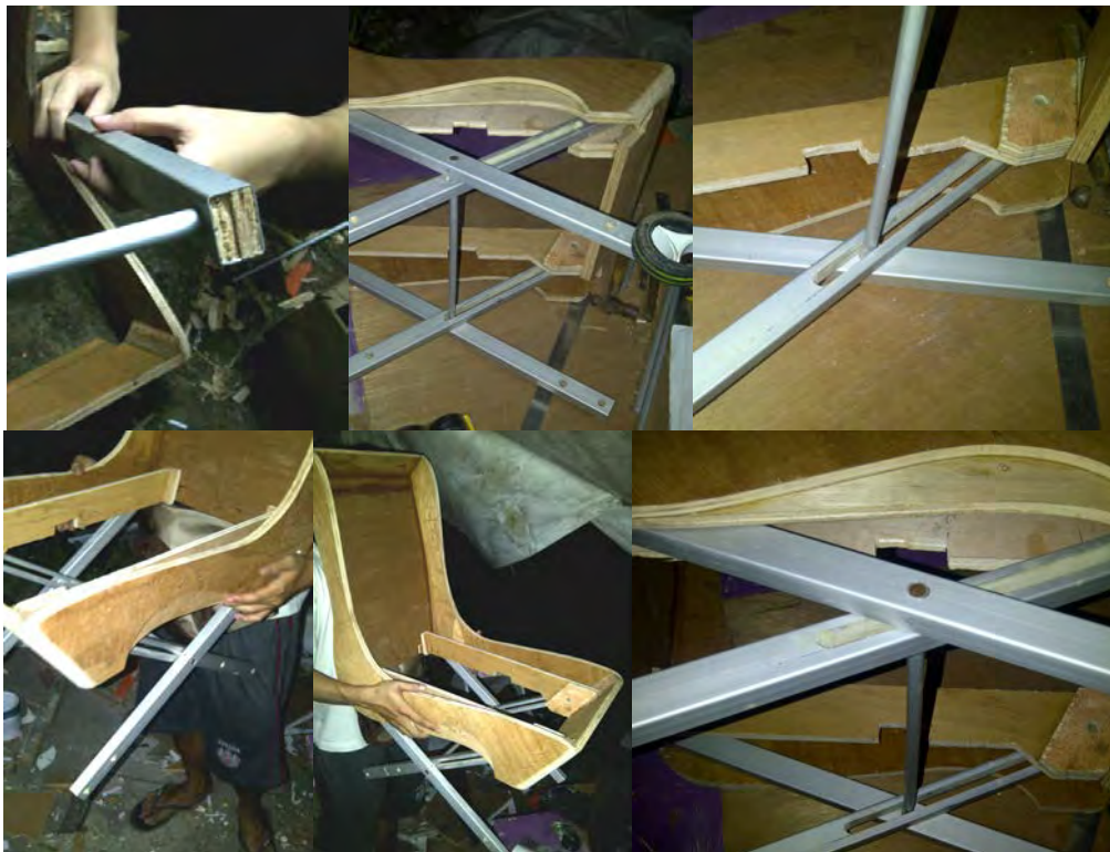
Gambar 7. Proses Pembuatan Kaki Kereta Prototip