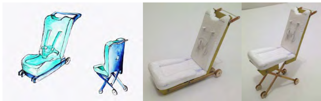
Gambar 2. Alternatif Terpilih Kedua Beserta Studi Model Produk