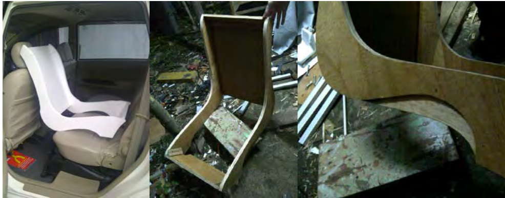
Gambar 6. Proses Pembuatan Base Prototip