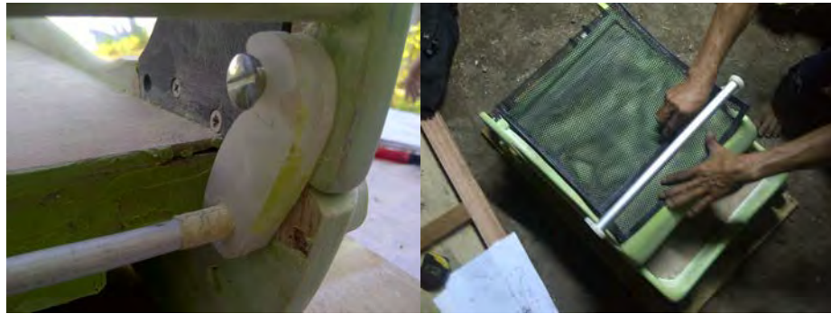
Gambar 9. Proses Penambahan Fitur pada Prototip