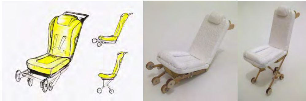
Gambar 3. Alternatif Terpilih Ketiga Beserta Studi Model Produk

Dari ketiga desain tersebut kemudian ditentukan satu desain akhir yang akan diwujudkan dalam bentuk prototype . Pemilihan desain akhir ditentukan dengan wawancara mendalam kepada beberapa konsumen. Hasil wawancara kemudian digabungkan dengan masukan dari pembimbing penelitian dengan harapan diperoleh desain yang optimal.