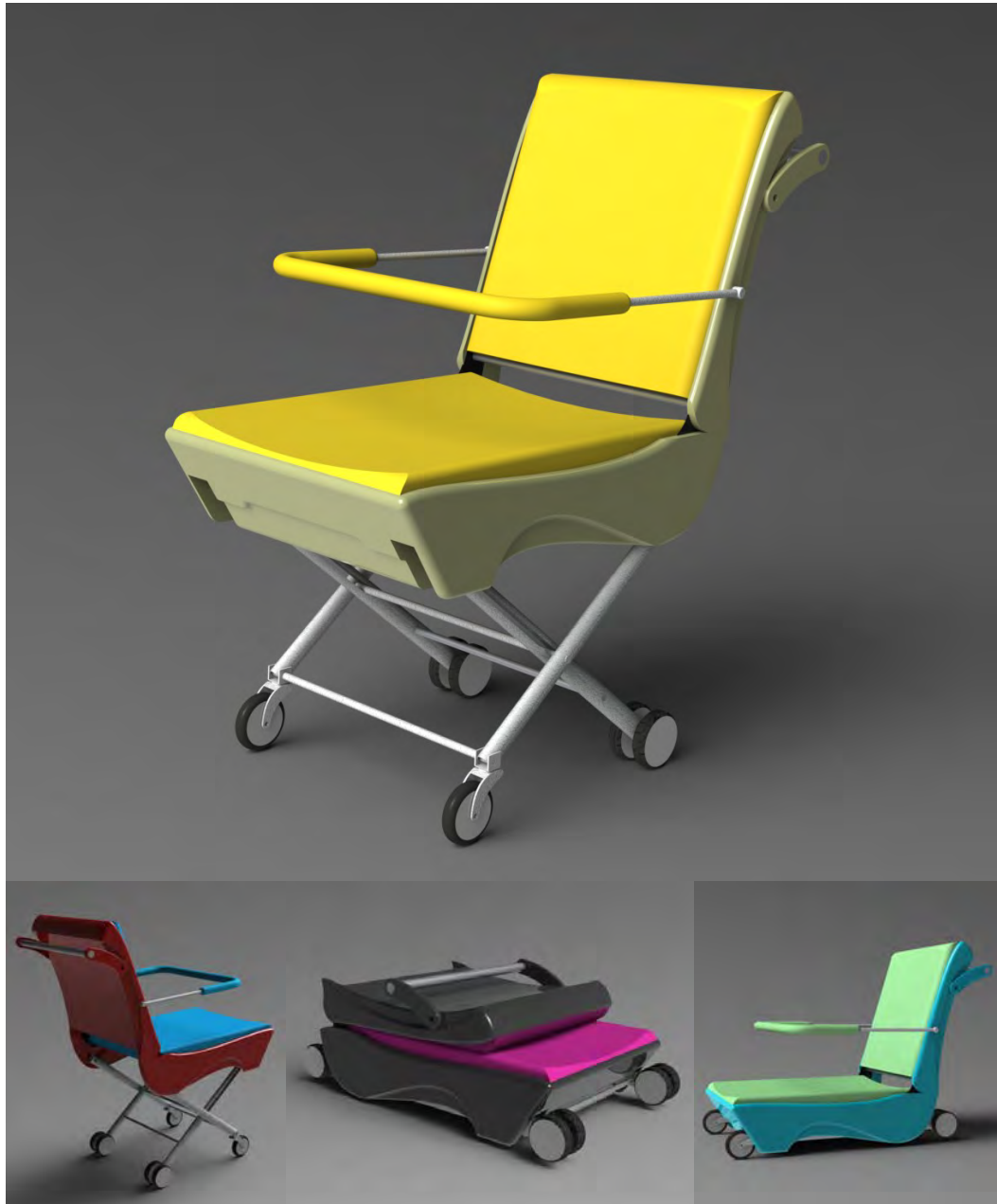
Gambar 5. Rendering 3D Produk

Perwujudan produk menjadi bentuk nyata atau prototype memakan waktu kurang lebih sebulan. Proses pembuatan prototype , dimulai dari proses percobaan dengan menggunakan sterofoam , pemotongan bahan dasar, pembuatan kaki kereta, perubahan bentuk dasar, pemasangan mekanisme, hingga proses penyusunan.