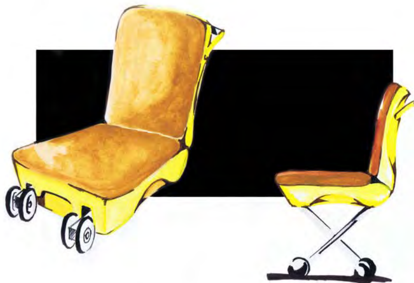
Gambar 4. Revisi Final Desain

Dari ketiga desain tersebut kemudian ditentukan satu desain akhir yang akan diwujudkan dalam bentuk prototype . Pemilihan desain akhir ditentukan dengan wawancara mendalam kepada beberapa konsumen. Hasil wawancara kemudian digabungkan dengan masukan dari pembimbing penelitian dengan harapan diperoleh desain yang optimal.