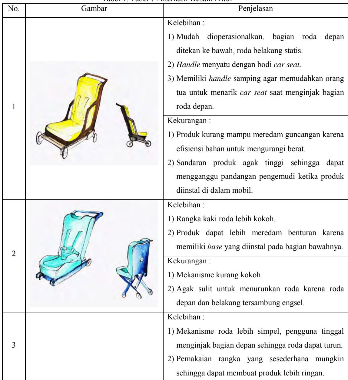
Tabel 1. Tabel 7 Alternatif Desain Awal

Langkah selanjutnya ialah penggambaran desain dalam bentuk alternatif desain. Dalam hal ini dibuat sebanyak 7 alternatif desain awal, yang nampak pada tabel di bawah ini.