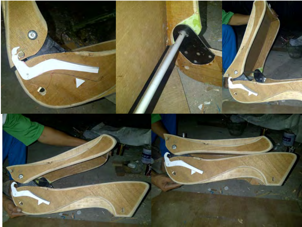
Gambar 8. Proses Pembuatan Mekanisme Lipatan pada Prototip

Tahap pengembangan bentuk dasar agar produk bisa dilipat.