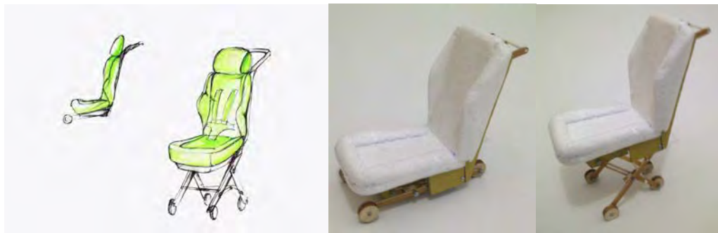
Gambar 1. Alternatif Terpilih Pertama Beserta Studi Model Produk

Ketujuh alternatif desain awal tersebut kemudian disortir dengan menggunakan sistem pembobotan, setelah pembobotan, dilakukan tahap pembuatan studi model untuk masing-masing alternatif terpilih agar dapat menganalisa mekanisme produk lebih lanjut. Berikut ini merupakan gambar dari 3 alternatif yang terpilih beserta studi model produk.