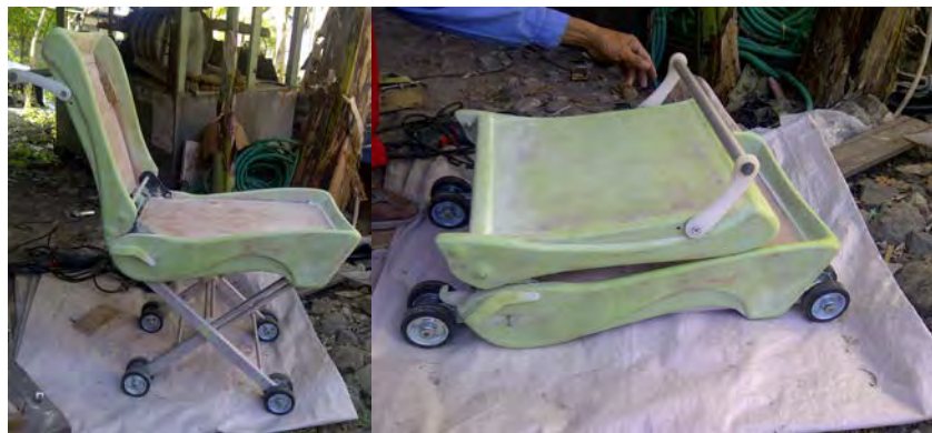
Gambar 10. Tahap Bentuk 70% Prototip

Prototype produk yang telah mencapai 100%, kemudian diujicobakan lagi kepada konsumen untuk mendapatkan feedback tentang produk, baik itu kelebihan produk maupun kekurangan yang perlu dibenahi lagi ke depannya.