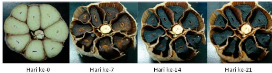
Gambar 1. Perubahan warna bawang selama fermentasi [21].

Bawang hitam tidak memiliki bau yang menyengat seperti bawang putih [8]. Hal ini dikarenakan zat allicin penyebab bau tidak sedap pada bawang akan diubah menjadi antioksidan selama proses fermentasi bawang putih menjadi bawang hitam [15,16,20]. Aroma bawang putih mulai hilang saat memasuki fermentasi hari ke-15 [18]. Antioksidan yang dihasilkan pada proses konversi tersebut di antaranya adalah senyawa SAC ( S-allyl cystein ) dan S-allylmercaptocysteine . Jumlah antioksidan yang dihasilkan semakin banyak seiring dengan semakin lama durasi fermentasi bawang hitam [15,16,20]. Bawang hitam mengandung zat anti kanker, anti inflamasi, anti-diabetes, anti bakteri, anti-allergi, dan antioksidan. Bawang hitam juga dapat menurunkan kadar kolesterol dan lemak jahat dalam tubuh [8,15-17,19].